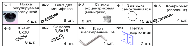
Таблица фурнитуры тумбы